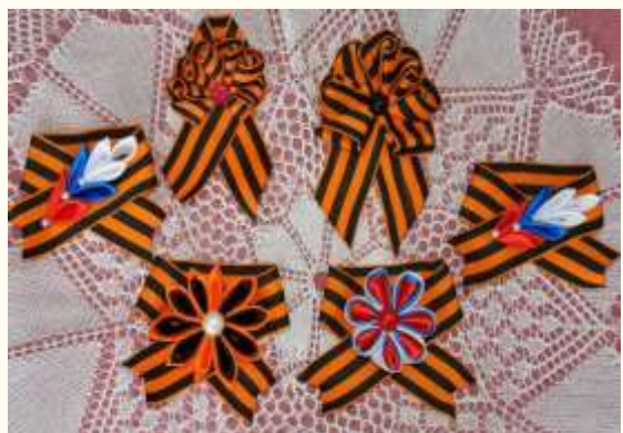
Варианты изготовления цветков в стиле «Канзаши» (на Георгиевкой ленте)